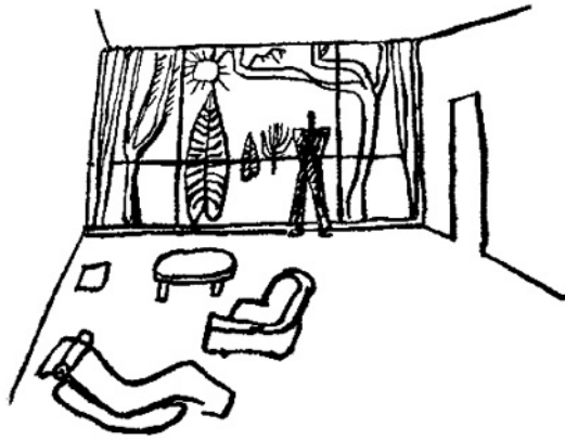
Figura. 3. “La naturaleza interviene en forma esencial en la función de habitar”. Los placeres esenciales de la naturaleza penetran la casa.

En esta apertura de la nueva arquitectura que conjuga cada uno de los anteriores valores, aparece el postulado siguiente: “... el sol, la vegetación y el espacio son las tres materias primas del urbanismo. La adhesión a este postulado permite juzgar las cosas existentes y apreciar las proposiciones nuevas desde un punto de vista verdaderamente humano” (LE CORBUSIER, 1981a, p. 42). Es decir, los elementos naturales (sol y vegetación) unidos a la arquitectura (espacio), permiten la introducción de valoraciones humanas al proceso arquitectónico, especialmente en la vivienda. Esta relación es habitar. Según Le Corbusier (1981a, p. 59-60), el sol es uno de los componentes más importantes en la nueva arquitectura que conectan al hombre con el espacio: “El sol es el señor de la vida”, dice. “la sociedad no tolerará que familias enteras se vean privadas de sol y condenadas por ello a languidecer (...) introducir el sol es el nuevo y más imperioso deber del arquitecto”.