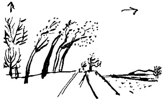
Figura 2. La luz. “El hombre es producto de la luz... no es el viento el que ha inclinado los árboles, sino que responden al llamado de la luz”. Fuente: Le Corbusier (1980a, p. 13)

Se ve pues cuán complejo es el problema...” (LE CORBUSIER, 1973b, p. 235-236, paréntesis nuestros).