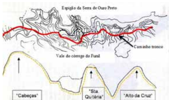
Figura 2: Imagem esquemática do caminho tronco com a elevação dos principais “morros” da cidade. Fonte: VASCONCELLOS, 1969, p. 73.