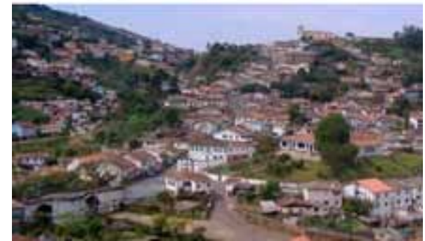
Figura 5: Bairro Antônio Dias e Alto da Cruz – Década de 50 e ano de 2007, respectivamente.

A partir da prática da aplicação das legislações urbanas municipais e portaria do IPHAN houve a necessidade de revisão do Plano Diretor e Lei de Parcelamento, Uso e Ocupação do Solo Municipal em conjunto com a Portaria 122, visando, dentre outros, a padronização dos valores de índices urbanísticos (coeficiente de aproveitamento, taxa de ocupação e taxa de permeabilidade), alteração no perímetro urbano e revisão do zoneamento.