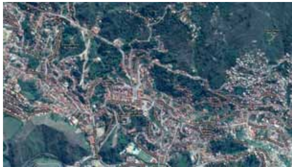
Figura 1: Imagem aérea do centro da cidade de Ouro Preto – Configuração orgânica.

Em 1935, Gustavo Barroso, Diretor do Museu Histórico Nacional, propôs um plano de restauração de Ouro Preto, contemplando apenas os monu-