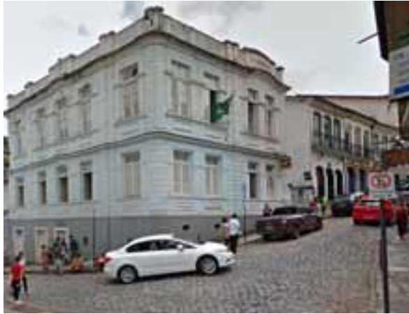
Figura 3: Prédio dos Correios, localizado à Rua Direita - Centro: um dos poucos exemplares preservados da arquitetura eclética em meio aos modelos coloniais.

mentos públicos civis e religiosos. Este plano também nunca foi implantado (EM DEFESA..., 2003).