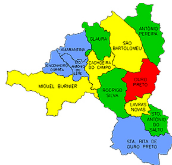
Figura 6: Mapa dos distritos de Ouro Preto.

dade como centro de formação de mão-de-obra especializada na conservação e restauração do patrimônio cultural e em atividades de suporte e desenvolvimento do turismo. Já no tocante ao papel polarizador dos demais distritos tem-se como diretriz a preservação e valorização do patrimônio cultural e natural (OURO PRETO, 2006). Cabe lembrar que Ouro Preto possui 13 distritos, incluindo o distrito sede (Figura 6).