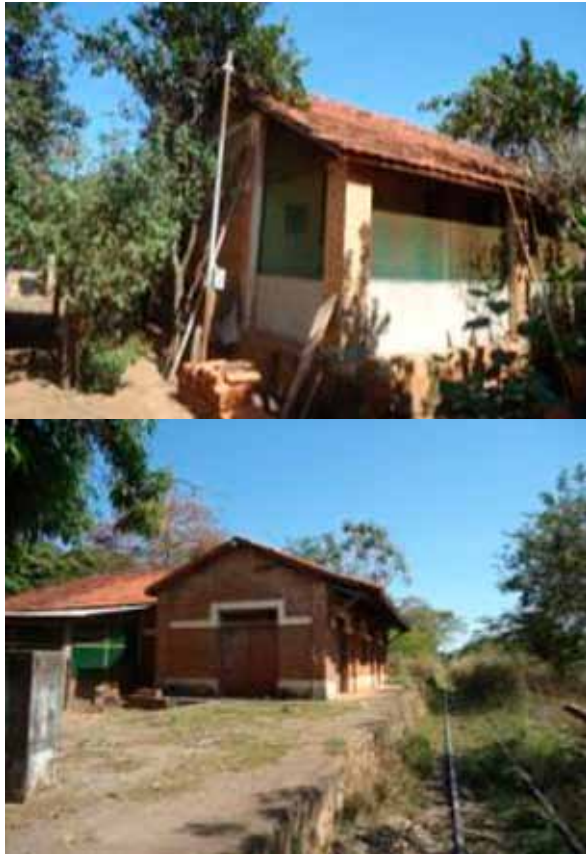
Figura 17 /e18. Tipologia típica de casa de ferroviário, apresenta tijolos aparentes e fachada avarandada, construída em alvenaria com telhado cerâmico, mantém o uso residencial. Antiga estação ferroviária.

sendo utilizadas como moradia, em algumas delas ainda é possível identificar as placas de patrimônio da RFFSA em sua fachada, e muitas de suas características arquitetônicas principais ainda estão preservadas, salvo por fatores ligados a ação do tempo, e a falta de manutenção adequada. (Figuras 15, 16, 17 e 18)