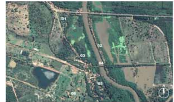
Figura 01. Povoado de Salobra. Imagem de Satélite. Legenda: 01 – Acesso pela rodovia / 02 – Principal concentração de edificações ribeirinhas / 03 – Complexo ferroviário desativado / 04 – Ponte ferroviária sobre o rio Miranda / 05 – principal núcleo urbano do povoado / 06 – Conjunto de edificações pertencentes a Igreja da Unificação. Fonte: Elaborado pelo autor sobre base do Google Earth.

Com a consolidação do projeto ferroviário e o sucesso de um trem que circulava livremente trazendo cargas e convidando novos visitantes a desbravarem a região, um grupo de indivíduos se assentou junto às ribeiras do rio Miranda 18 , ali construíram as primeiras edificações, muitas vezes içadas sobre palafitas, proporcionando para aqueles para quem o trem não era mais uma novidade empolgante, o começo de uma nova relação de intimidade e trabalho com aquelas terras alagáveis, naquela região que é considerada o portal do Pantanal Sul-Mato-Grossense.