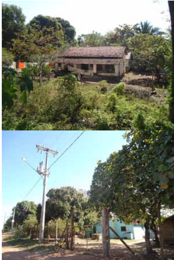
Figura 02 e 03. Vistas de casas na entrada do povoado a partir da rua.

19 Referente à Igreja da Unificação, fundada pelo reverendo Sun MyungMoon, presente em mais de 120 países e com forte presença no Mato Grosso do Sul, especificamente no povoado de Salobra.