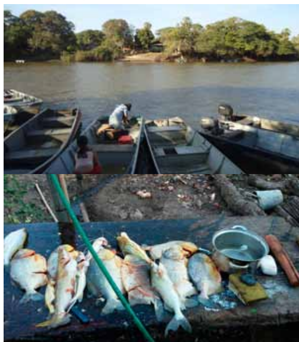
Figura 05 e 06. Barcos atracando ao fim do dia e parte dos pescados.

Eu quero te mostrar uma casa de ribeirão de verdade, algumas delas estão lá na margem do salobrinha ou do Miranda, mas só as mais simples... As grandonas, mais chiques são tudo hotel, os turistas são bons, mas turista de verdade é aquele que vem, conhece e vai embora... Os que ficam tiram os pescadores das margens e criam hotel, constroem casa. Aqui é parte boa, parte nobre, mas hoje em dia tem ribeirão morando em casa parecida, de tijolo, nem nas margens do rio, nem aqui no centro, fica no meio termo (grifo meu) 20 . (Figura 04, 05 e 06)