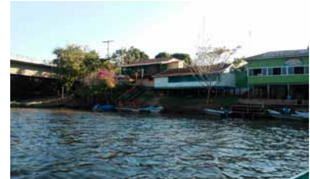
Figura 09 e 10. Vista de um conjunto de casas sobre palafitas, típica de ribeirinhos, percebe-se a estrutura que eleva o imóvel com o intuito de buscar refúgio em períodos de cheia, o emprego da madeira e a tipologia que preza a funcionalidade, a quantidade de barcos encostados sugere que ali se encontra um grupo grande de pescadores. Edificações ribeirinhas convertidas em pousadas, relatadas pelos moradores como grande atrativo para os turistas que vem passar temporadas na região enquanto pescam.

lhava antes na época do antigo dono que era o Claudio, e como eu trabalhava como piloto de barco, já segui trabalhando com o grupo do Reverendo, o próprio Reverendo Moon investiu pesado aqui no Salobra, não só no Salobra mas em todo o Mato Grosso do Sul , porque ele tinha uma visão de proteger o Pantanal. (...) e então ele viu aqui um potencial muito grande, ele queria preservar e proteger, proteger em que sentido? No Brasil tem a lei que diz que você pode trabalhar 80% e preservar os outros 20, mas para Reverendo Moon, você pode proteger 80%, ou seja, não tocar, não remover, não desmatar, e trabalhar 20% para preservar o meio ambiente. Então, ele queria provar isso, inclusive na época eu pilotei para pesquisadores das Nações Unidas, (...) Mas o ponto focal dele era o agrotóxico nas lavouras, e as outras é as queimadas, o fogo