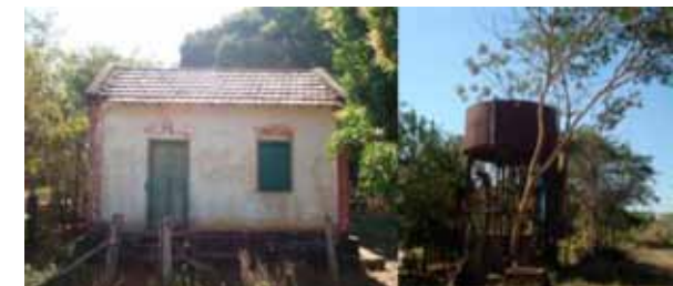
Figura 15 e 16. Vista de antigo escritório da EFNOB, edificação em alvenaria com fundação em pedras e telhado cerâmico, atualmente é utilizada como residência. Antiga caixa d’água para abastecimento das locomotivas, construída com concreto e metal, a mesma ainda apresentação o brasão da Noroeste do Brasil (NOB) e é considerada por alguns moradores como um ponto de referência.

Salobra – inclusive a própria ponte metálica –, de forma que, a antiga estação de trem se encontra lacrada e sem uso, enquanto edificações como oficinas, escritórios e vila dos ferroviários, vem