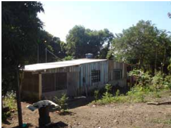
Figura 04. Tipologia de casa de madeira encontrada no povoado, térrea avarandada (fechada), com telhado de pouca inclinação e construída em madeira.

como uma ameaça, como explica uma moradora