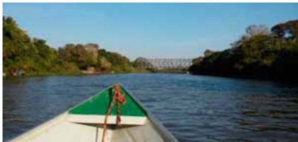
Figura 22. Vista da ponte no horizonte a partir do rio Miranda. A composição vegetal preservada das margens aliada a construção humana formam a paisagem-Lugar do povoado de Salobra.

33. The capacity to control the heritage process – the experiences of place and the practices of remembering – that defines and gives meaning to constructions of identity is an integral element of the heritage process itself. Without control over this process, or a sense of active agency in it,