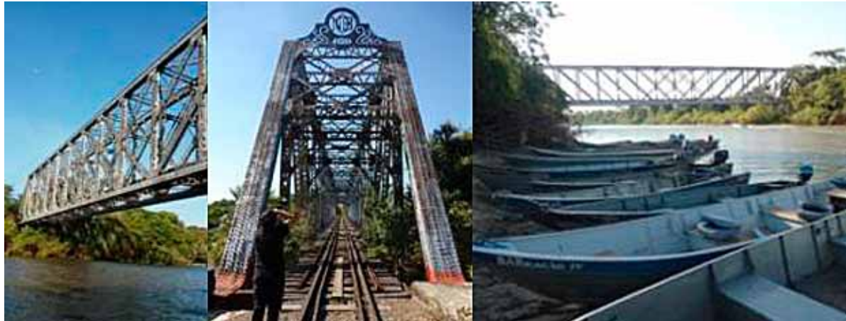
Figura 19 / 20 / 21. Vistas da ponte nos dias atuais, ela sempre é identificada como uma referência na paisagem, em terra ou na água.