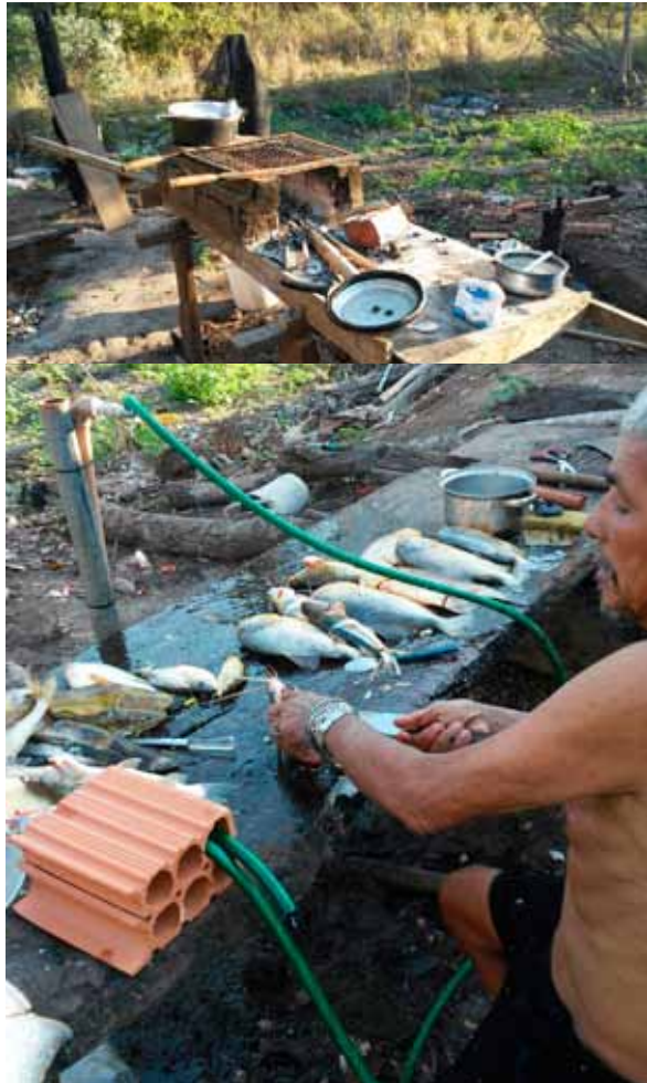
Figura 07 e 08. Vistas do interior de uma propriedade de pescador. Localizada a alguns metros das margens do rio, é montada uma espécie de cozinha na parte externa da casa, em uma das bancadas o próprio pescador se encarrega de ao final do dia, realizar a limpeza do peixe que pescou, após o procedimento, é separado o que será comercializado e o que será consumido pelo próprio e sua família, geralmente uma grelha improvisada com tijolos e carvão ali ao lado já serve para preparar o almoço/jantar. Foto: Vinicius Martins de Oliveira (2016).