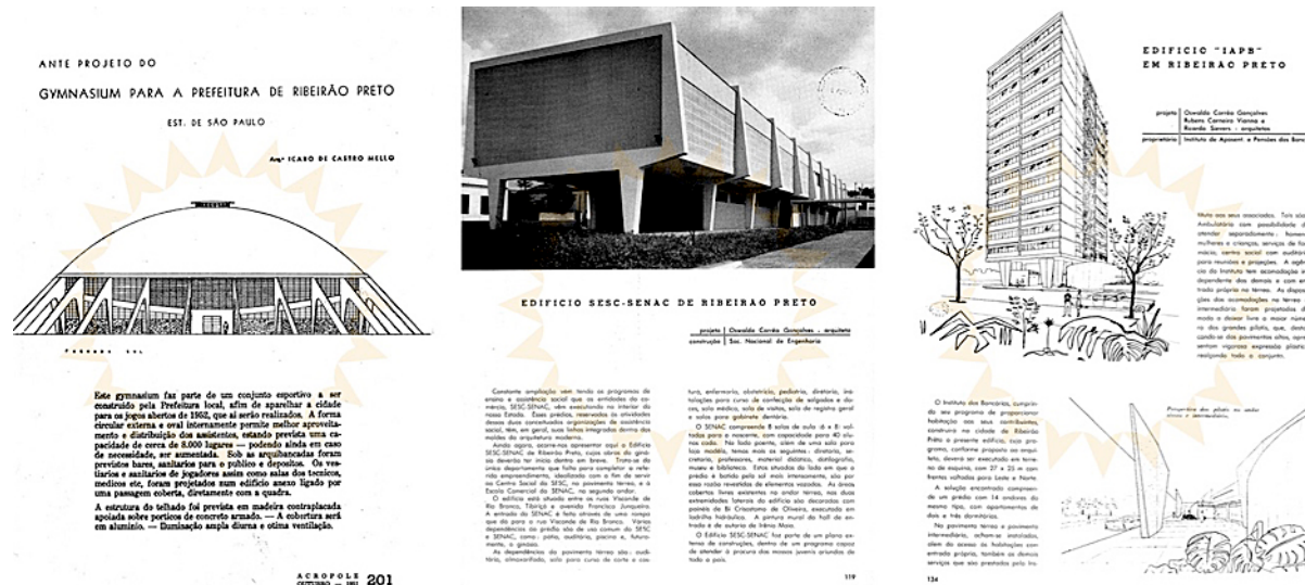
Figura 3: Os três projetos em Ribeirão Preto publicados na Revista Acrópole na década de 1950: produção modernista marcando a paisagem. Fonte: MELLO, Ícaro de Castro. Anteprojeto do Gymnasium para a Prefeitura de Ribeirão Preto. Acrópole, São Paulo, n. 162, out. 1951, p. 201-206. Disponível em: http://www.acropole.fau.usp.br/edicao/162 Acesso em 10 out. 2016; GONÇALVES, Oswaldo Corrêa. Edifício SESC-SENAC de Ribeirão Preto. Acrópole, São Paulo, n. 220, fev. 1957, p. 119-123. Disponível em: http://www.acropole.fau.usp.br/edicao/220 Acesso em 10 de out. 2016; GONÇALVES, Oswaldo Corrêa. Edifício IAPB em Ribeirão Preto. Acrópole, São Paulo, n. 232, fev. 1958, p. 134-135. Disponível em: http://www.acropole.fau.usp.br/edicao/232 Acesso em 10 de out. 2016;

2. Pode-se ler no web-site da SAJAR, Associação dos Moradores do Jardim Recreio < http://www.sajar.com.br >, um breve texto sobre a história do bairro.