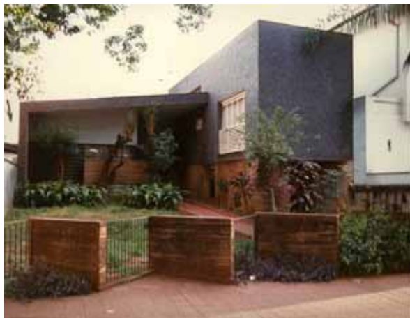
Figura 5: Acima à esquerda, foto da 1ª Residência José Penteado, projeto de 1955 do arquiteto Ijair Cunha. Acima à direita, foto atual do local onde antes existia a residência, na Avenida Nove de Julho.