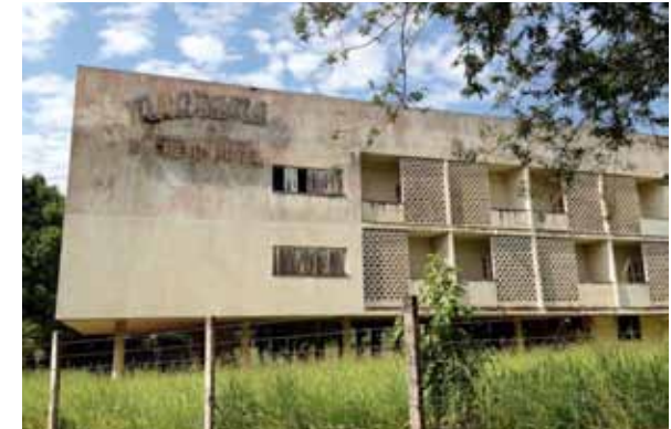
Figura 4: Ruínas do Hotel Umuarama, em Ribeirão Preto. Projeto da década de 1960, do engenheiro Hélio Fóz Jordão. Exemplar modernista abandonado. Fonte: Acervo de Larissa França Peres (12/2013).

emblemático: se edifícios grandes são abandonados ou reformados, sem que o partido arquitetônico original seja respeitado, isso comparece de maneira ainda mais grave na conservação de residências.