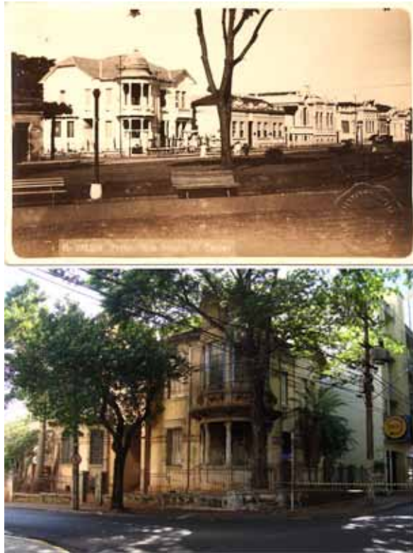
Figura 2: Nas fotografias acima, Palacete Camilo de Mattos visto da Praça XV, em primeiro plano, no centro de Ribeirão Preto. Residências que se destacavam individualmente. Fonte: Arquivo Histórico de Ribeirão Preto (1922/1930). À direita, foto atual do Palacete Camilo de Mattos. Fonte: acervo do autor (02/2014).

1. Em 1929 ocorre a Crise da Bolsa de Valores de Nova York, afetando negativamente toda a produção industrial do Brasil e do Mundo. Em Ribeirão Preto não poderia ter sido diferente, principalmente ao se levar em conta a pujança e importância da produção cafeeira do município. No entanto, as informações acerca do real impacto da