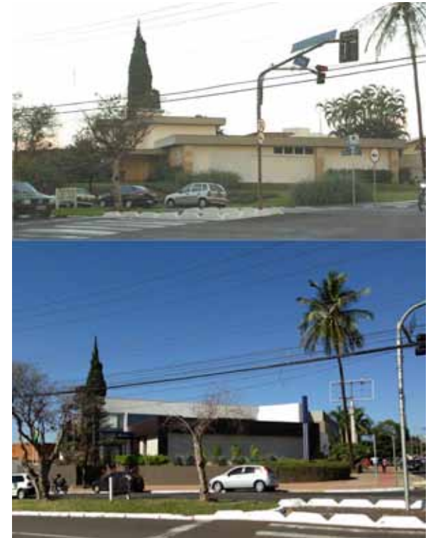
Figura 7: Acima, Residência Teresa Rizzo, projeto de 1963 do engenheiro Hélio Fóz Jordão. Fonte: acervo da arquiteta Rita Fantini (ano desconhecido). Abaixo, agência bancária construída no local em que antes estava a casa, demolida parcialmente e utilizada para a composição do novo edifício. Fonte: acervo do autor (05/2013).

to em conservação. De influência “Wrightiana” 5 , o projeto arquitetônico de autoria do engenheiro Hélio Fóz Jordão (o mesmo projetista do Hotel Umarama e do plano para o bairro Jardim Recreio), chamava a atenção por ter se mantido desprovida de portões ou muros.