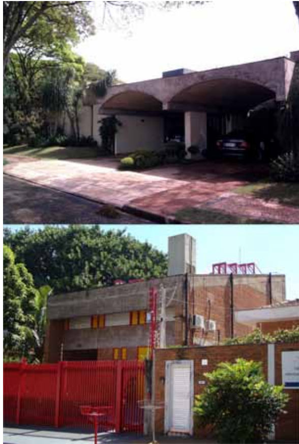
Figura 9: Na foto à esquerda, Residência Maurício Marcondes, projeto de 1966. E à direita, Residência Anderson Gattás, projeto de 1970. Ambos projetos dos arquitetos Francisco Segnini Júnior e Joaquim Cláudio Barretto em Ribeirão Preto. As casas encontram-se perfeitamente preservadas. Fonte: acervo do autor (09/2011 e 03/2012).

7. Como na Residência Roberto Millan, por exemplo, projeto de 1960 do arquiteto Carlos Millan. Na casa, localizada no bairro Alto de Pinheiros em São Paulo, o dormitório de empregados ocupa