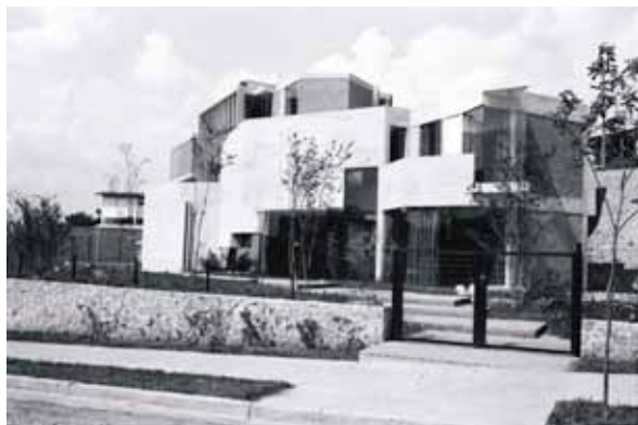
Figura 10: Residência Waldo Perseu Pereira, localizada no bairro Jardim Guedala em São Paulo, projeto de 1966 dos arquitetos Joaquim Guedes e Liliana Marsicano. Na imagem à esquerda, fotografia da casa quando de sua conclusão. Na imagem à direita, fotografia recente da casa, depois de uma reforma que descaracterizou a arquitetura.