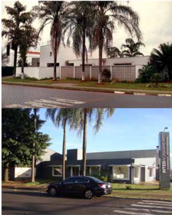
Figura 8: Acima, fotografia da 1ª Residência Luiz Bueno Brandão, projeto de 1967 dos arquitetos Francisco Segnini Júnior e Joaquim Cláudio Barretto. Abaixo, fotografia da casa reformada e transformada em um edifício de uso comercial.

6. Os arquitetos ainda projetariam uma segunda residência para esse mesmo cliente, em 1975, no bairro Ribeirão.