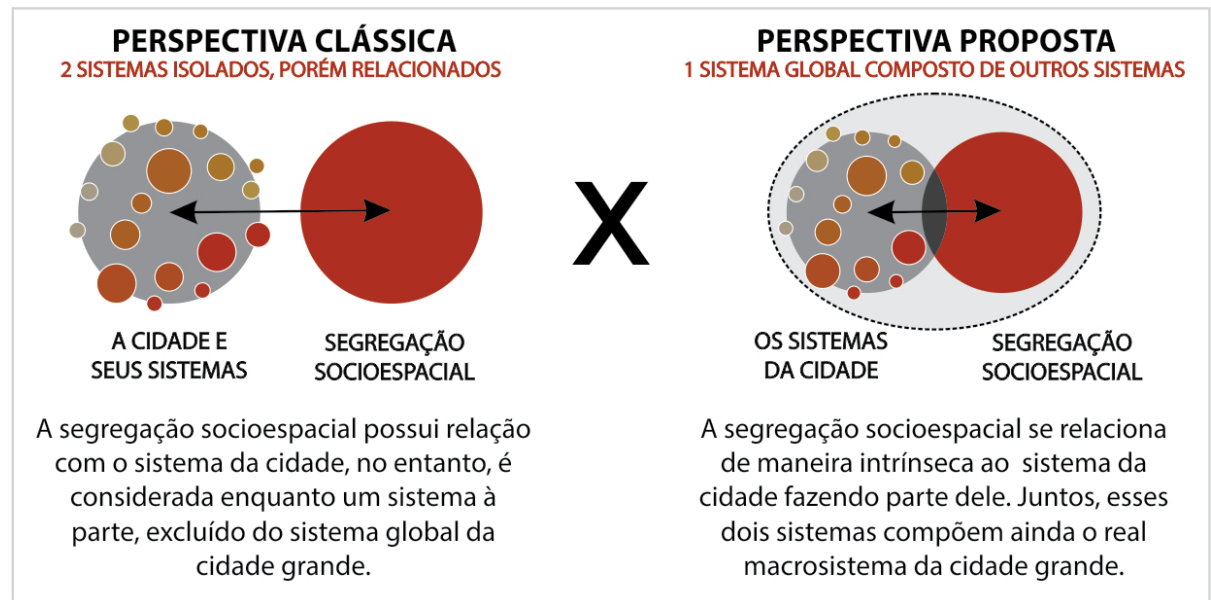
Figura 3. Diagrama da perspectiva clássica X Diagrama da perspectiva proposta na pesquisa.

É possível notar que o padrão de urbanização atual – internacional e nacional – conforma regiões metropolitanas descontínuadas e heterogêneas, tanto na morfologia espacial quanto nas caracte-