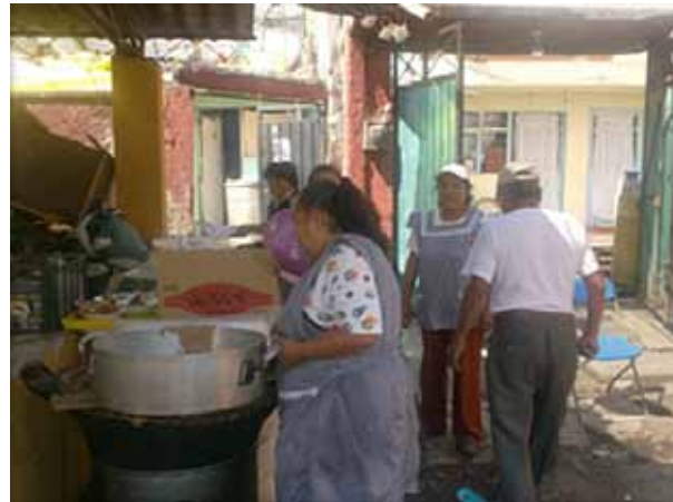
Figuras 4 a - La Vivienda en San Luis Tlaxiátemalco.

La aplicación de métodos de investigación del campo social a la arquitectura de la vivienda de autoproducción permite: Comprender Necesidades del grupo doméstico (por ejemplo: la relación del lavadero y la fiesta); Identificar en el “otro” potencialidades tales como la cultura chinampera como un proceso sustentable o la forma de organizar fiestas patronales partiendo de relaciones de reciprocidad y dificultades, como podrían ser la manera de organizar el espacio; Identificar y conocer la relación dinámica entre espacio habitable y grupo doméstico; ubicar patrones culturales en el uso del espacio doméstico como procesos constantes de los aspectos: Ambientales, Socioculturales, Políticos, Económicos tecnológicos, Determinantes en las formas de habitar. (Figuras 4 a-c)