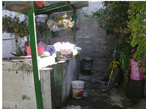
Figuras 4 c - La Vivienda en San Luis Tlaxialtemalco.