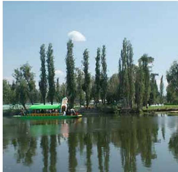
Figuras 3 - Xochimilco.

Como ya se mencionó, Xochimilco se ha convertido en un sitio turístico; por lo tanto, la actividad económica principalmente es el sector terciario a partir del servicio tanto en el pueblo como en otras partes de la ciudad; sin embargo, actualmente aunque en menor grado, su actividad agrícola ocupa un porcentaje significativo para la ciudad. (Figura 3)