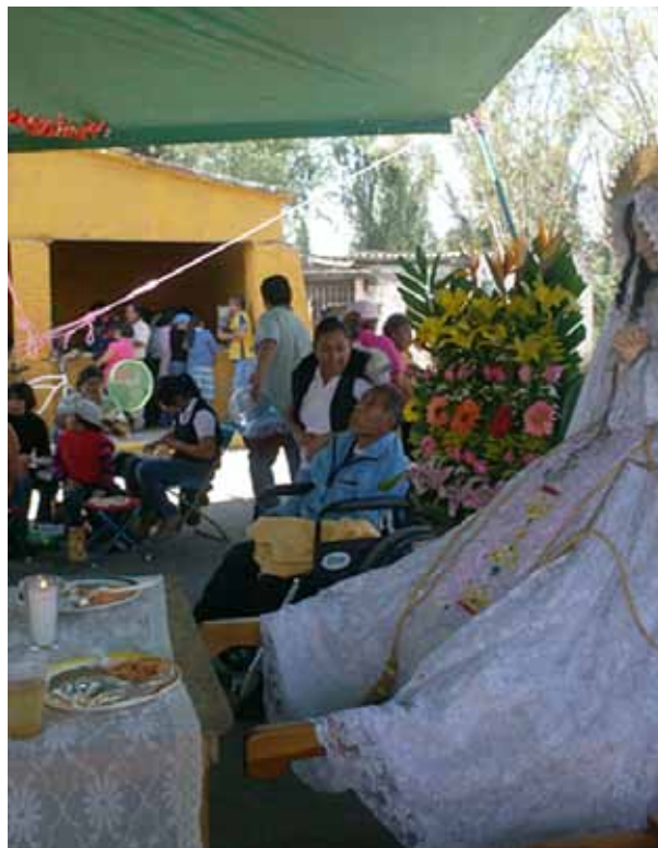
Figuras 2 b - Fiesta de la Virgen de los Dolores.