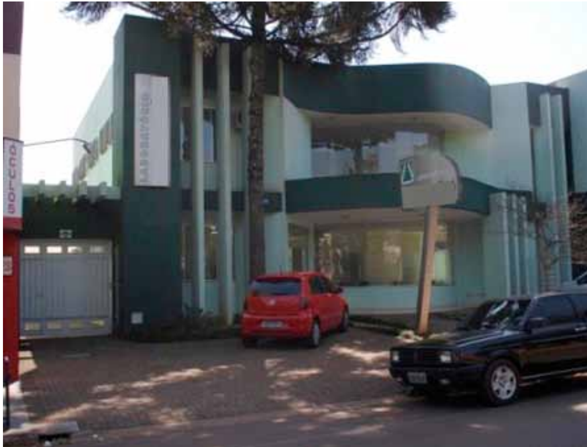
Figura 2. Fachada da edificação.

do há 10 anos no local. No terreno de 950 m 2 , a edificação totaliza 856,82 m 2 de área construída, setorizada em três setores que se distribuem por dois pavimentos.