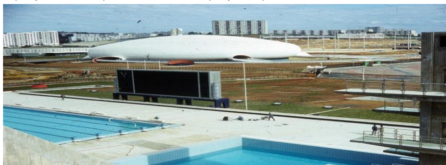
Figura 4. Estadio La Coupole, Argel, Oscar Niemeyer.

Y en el mismo territorio argelino se construyó su proyecto para un estadio en el complejo olímpico donde se desarrollarían los Juegos Mediterráneos de 1975 que tuvieron lugar en Argel. El estadio, como su nombre lo indica, tiene la forma de una cúpula blanca y remite al proyecto previo no realizado para una mezquita también en Argelia. En ambos casos Niemeyer realiza una reinterpretación del imaginario orientalista de las cúpulas bulbosas en clave moderna combinado con su interpretación del espacio para congregación de público cubierto con una gran cubierta plástica que ya había implementado en su proyecto para la catedral de Brasilia.