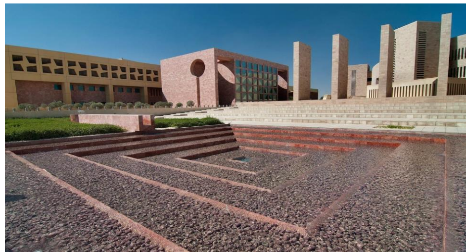
Figura 7. Fuente y acequia en la Carnegie Mellon University, Qatar, Ricardo Legorreta

ellas en Qatar, así como el campus de la American University at Cairo en Egipto (figura 7 y 8). En todas ellas, al igual que en el proyecto de la casa antes descrita, se emplean volúmenes prismáticos, patios, celosías, fuentes y los intensos colores barraganianos, aunque en estos casos convertidos en grandes volúmenes propios de edificios institucionales. También es constante en ellos la exitosa adaptación en el contexto medio oriental.