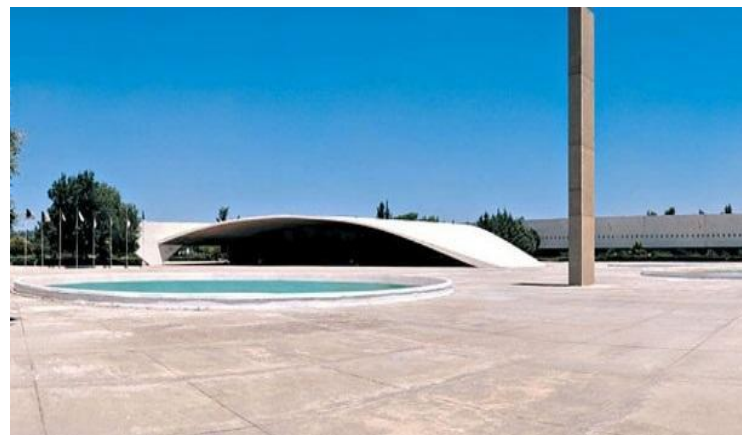
Figura 2. Universidad Mentouri en Constantine, Argelia, Oscar Niemeyer. By Luiz Claudio Lacerda - Divulgação, CC BY-SA 4.0, https://commons.wikimedia.org/w/index.php?curid=76564758

Luego de su experiencia en Israel, y a raíz del ya mencionado golpe de estado en Brasil, Niemeyer vivió exiliado en Francia hasta el final de la dictadura en la década de 1980. Desde París diseñó una docena de proyectos para Argelia 3 . Algunos de ellos se construyeron, como el caso de la Universidad Mentouri en Constantine con su cubierta que asemeja un libro abierto. Aquí una vez más el tradicional juego de volúmenes blancos que caracteriza la obra de Niemeyer no resulta mayormente contrastante en el contexto del Oriente Medio.