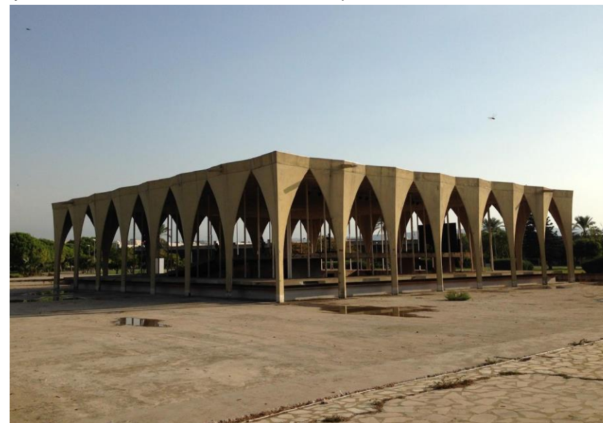
Figura 5. Rashid Karami International Fair, Trípoli, Líbano, Oscar Niemeyer.

de la década de 1960 en el contexto de su fama mundial por la recién inaugurada Brasilia. Allí le encomendaron el diseño de un predio ferial permanente cuya construcción comenzó en 1964 y que se encontraba inconcluso cuando se desató la guerra civil en el Líbano en 1975 por lo cual nunca fue concluido. En los distintos pabellones de la Feria, Niemeyer continúa con varios de los modelos que había implementado en Brasilia, como grandes explanadas junto con formas curvas y cúpulas de hormigón. Pero particularmente se puede destacar el sistema de edificios prismáticos rodeados de pórticos con arcos monumentales. En este caso, el arquitecto emplea un tipo de arco similar al ojival que no se había observado antes en sus obras más emblemáticas, tal vez esto implica alguna alusión al arco túmido o arco apuntado propio de Medio Oriente, como una voluntad de adaptar su sistema proyectual al nuevo contexto en el cual se implantaría.