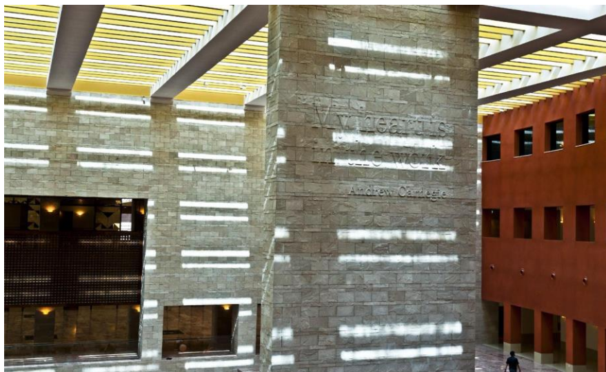
Figura 8. Atrio de la Carnegie Mellon University en Qatar, Ricardo Legorreta

Se podría afirmar como conclusiones preliminares que en la obra de Legorreta en Oriente Medio pueden observarse temas comunes a los ya presentados previamente para otros arquitectos. Es constante la voluntad de plantear en este nuevo contexto obras basadas en lineamientos muy similares a los de su obra canónica latinoamericana, ocasionalmente algunos aspectos son “adaptados”, pero lo más singular, y en el caso de la estética barraganiana de Legorreta se hace muy evidente es como las estrategias de diseño originalmente mudéjares de la arquitectura colonial “vuelven” muy exitosamente a su lugar de origen a través de la reinterpretación americana.