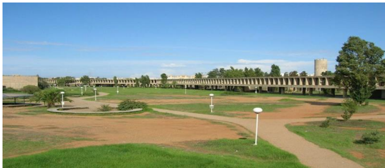
Figura 3. Universidad Tecnológica Houari Boumediene, Argelia, Oscar Niemeyer. By K1saïd 2005 - Own work, CC BY-SA 3.0, https://commons.wikimedia.org/w/index.php?curid=26280180

Y en el mismo territorio argelino se construyó su proyecto para un estadio en el complejo olímpico donde se desarrollarían los Juegos Mediterráneos de 1975 que tuvieron lugar en Argel. El estadio, como su nombre lo indica, tiene la forma de una cúpula blanca y remite al proyecto previo no realizado para una mezquita también en Argelia. En ambos casos Niemeyer realiza una reinterpretación del imaginario orientalista de las cúpulas bulbosas en clave moderna combinado con su interpretación del espacio para congregación de público cubierto con una gran cubierta plástica que ya había implementado en su proyecto para la catedral de Brasilia.