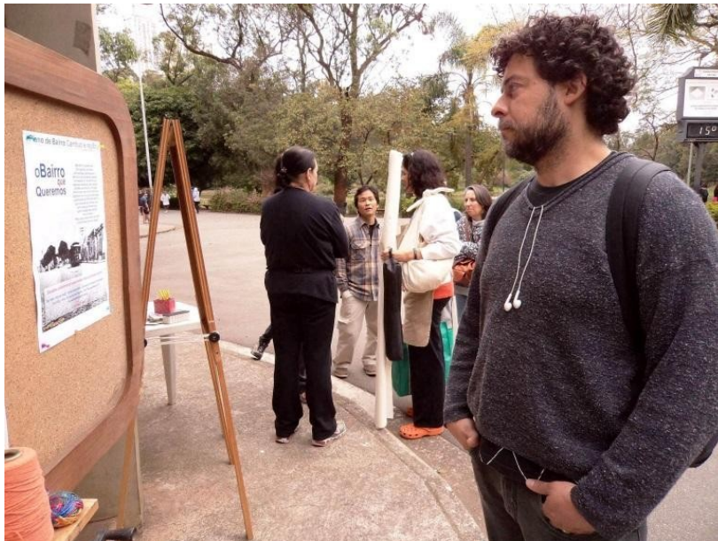
Figura 1: Atividades participativas para o Plano de Bairro do Cambuci e Região no Parque da Aclimação organizada pelo SENAC – Aclimação e REDESC na "Virada Ambiental" em 2013.

Apresentamos a seguir um registro fotográfico realizado durante a atividade de um dia ao final de semana no quiosque do Parque da Aclimação em 2013, no evento "Virada Ambiental". Nesse evento pessoas presentes no parque participaram das atividades sendo abordadas, apresentando a proposta do Plano de Bairro; participando de um mapeamento sobre o deslocamento desde sua moradia até o parque; da dinâmica do "varal dos sonhos", na qual, em um varal, pessoas penduravam suas ideias escritas em papéis coloridos para melhorar o bairro; crianças eram convidadas a pintar coletivamente seus sonhos para o bairro em um tecido grande; entre outras atividades.