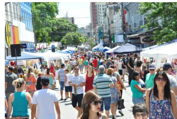
Figura 5. Feira do Príncipe (Rua do Príncipe).

Mensalmente, ao segundo domingo do mês, a Rua do Príncipe e a Praça Nereu Ramos sediam a Feira do Príncipe (Figura 5 e Figura 6), evento que leva ao centro da cidade cerca de 300 expositores, que oferecem opções diversas de artes, artesanato, antiguidades, brechó e gastronomia. Em conjunto à feira são realizadas, no palco da Praça Nereu Ramos, apresentações culturais de música, dança e teatro.