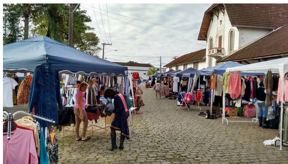
Figura 4. Sábado na Estação - Mercado de Pulgas.

O Sábado na Estação (Figura 4) é um projeto implantado em 2010, pela Fundação Cultural de Joinville, que procura potencializar a edificação tombada da Estação Ferroviária como um espaço de referência para memória e múltiplas sociabilidades. Realizado mensalmente, no terceiro sábado mês, o evento conta com feira de artesanato, brechó, o Mercado de Pulgas (uma feira de antiguidades destinada a venda ou troca de bens antigos e ou usados) e gastronomia, com a comercialização de produtos coloniais. Também conta com apresentações culturais como exposições, música e teatro, organizadas pela FCJ (JOINVILLE, 2012). Diante da renovação das políticas culturais no município, esse evento pode ser caracterizado como uma experiência piloto para o desenvolvimento de programas de feiras na cidade.