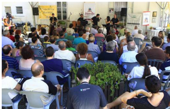
Figura 3. Concerto Matinal na Casa da Memória.