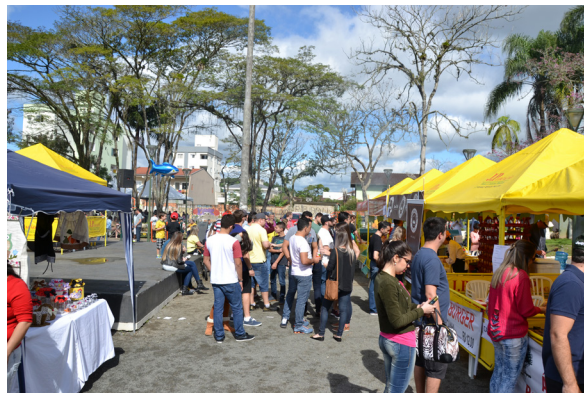
Figura 7. Feira do Floresta (tendas).

Integrante do programa Feiras nos Bairros, a Feira do Floresta (Figura 7 e Figura 8) é realizada na Praça Tiradentes, no quarto sábado de cada mês. Sua organização é compartilhada com os moradores do bairro Floresta e a feira impõem, como condição de participação, que os expositores sejam residentes do próprio bairro. Os principais itens expostos e comercializados são o artesanato e a gastronomia, junto a isto, a Feira do Floresta ainda tem como atrativo apresentações musicais e de dança (PREFEITURA DE JOINVILLE, 2016).