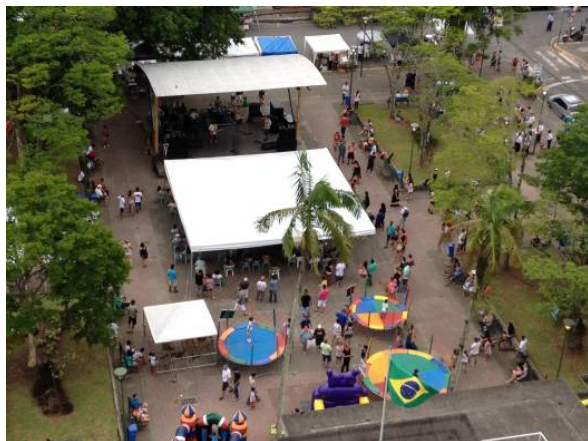
Figura 6. Feira do Príncipe (Praça Nereu Ramos).

Integrante do programa Feiras nos Bairros, a Feira do Floresta (Figura 7 e Figura 8) é realizada na Praça Tiradentes, no quarto sábado de cada mês. Sua organização é compartilhada com os moradores do bairro Floresta e a feira impõem, como condição de participação, que os expositores sejam residentes do próprio bairro. Os principais itens expostos e comercializados são o artesanato e a gastronomia, junto a isto, a Feira do Floresta ainda tem como atrativo apresentações musicais e de dança (PREFEITURA DE JOINVILLE, 2016).