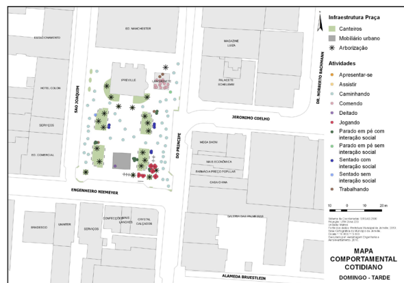
Figura 12. Mapa Comportamental 1 – Domingo Cotidiano. Fonte: Elaborado pela autora (2017).

Os Mapas Comportamentais 2 e 3, representados respectivamente nas Figuras 13 e 14, indicam um aumento considerável no número de usuários utilizando à Praça Nereu Ramos no domingo em função da realização desses eventos culturais. É interessante destacar, que as atividades obser-