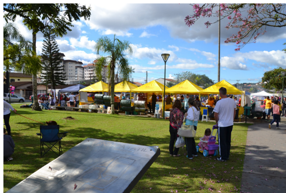
Figura 8. Feira do Floresta (praça).

Seguindo esse formato, a Feira do Vila Nova (Figura 9 e Figura 10) também expõe apenas o trabalho de moradores do bairro, oferecendo produtos artesanais variados, brechó, venda e troca de livros e gastronomia. Também reserva espaço para que novos artistas do Vila Nova se apresentem, especialmente na área musical. A feira acontece no terceiro sábado de cada mês, próximo ao Terminal Urbano do bairro. Sua organização é compartilhada entre a FCJ e representantes do Conselho das Associações do Vila Nova (PREFEITURA DE JOINVILLE, 2016).