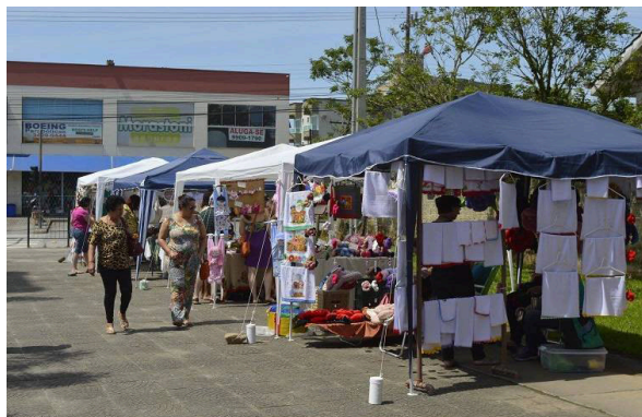
Figura 9. Feira do Vila Nova.