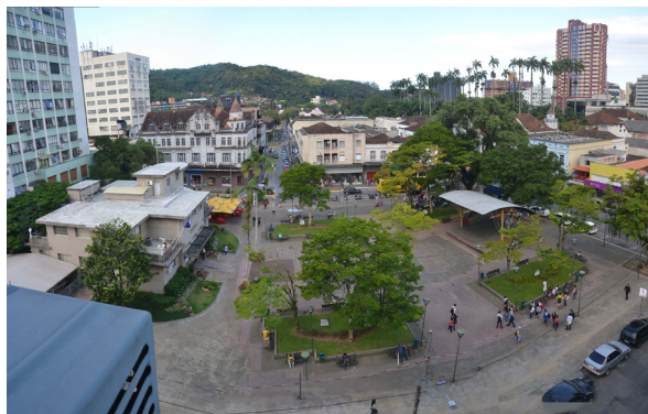
Figura 11. Praça Nereu Ramos.

entorno. Assim, verifica-se uma maior interação de passagem e permanência entre os usuários da praça e dos comércios lindeiros, sobretudo pela continuidade no passeio público e presença de fachada ativa, na Rua do Príncipe e São Joaquim. Suas ambiências de estar estão vinculadas à presença de mobiliário urbano, vegetação e equipamentos locados no espaço: mesas de jogos, palco e lanchonete (Figura 11).