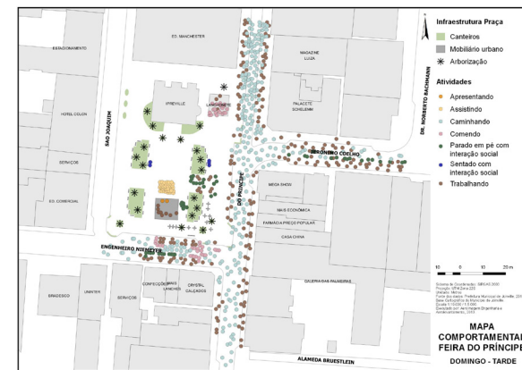
Figura 13. Mapa Comportamental 2 – Feira do Príncipe.