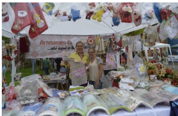
Figura 10. Artesãos da Feira do Vila Nova.

fluenciada pelo universo definido, os usuários da praça. Nesse sentido, para uma avaliação mais ampla do alcance e aceitação das políticas culturais de realização de eventos em espaços livres públicos, no contexto municipal, seria relevante a expansão do universo da pesquisa a fim de abranger também pessoas que não se utilizam desse espaço. Todavia, como o foco da pesquisa era a opinião dos usuários do espaço estudado acerca da presença de eventos culturais em espaços livres públicos, sobretudo, na Praça Nereu Ramos, optou-se pela abordagem qualitativa na pesquisa. As respostas foram analisadas e agrupadas em categorias iniciais a partir das similaridades entre os discursos e posteriormente reagrupadas com base na ideia central das falas, resultando em cinco categorias finais.